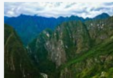
Los Andes tropicales