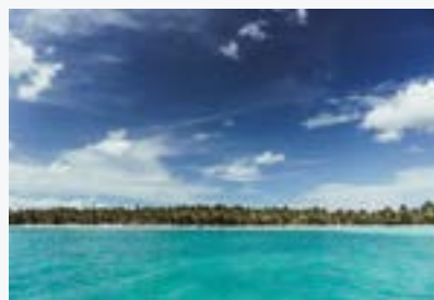
El mar Caribe