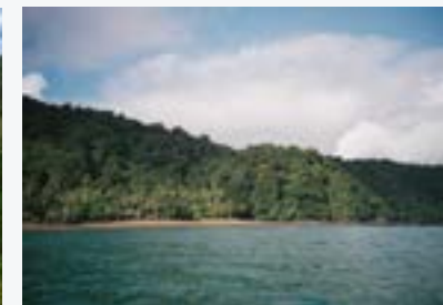
La región Tumbes-Choco-Magdalena.

Los ecosistemas incluyen siete de los 36 puntos críticos de biodiversidad terrestre del mundo y abarcan una gran parte de la biodiversidad de la región de ALC, que comprende un estimado del 60-70% de la biodiversidad mundial. 80 Al ofrecer su apoyo en la conservación y el uso sostenible de estos ecosistemas, CAF puede catalizar la preservación y restauración de paisajes y hábitats que son vitales para mantener la conectividad genética y prevenir el colapso de los ecosistemas, lo que representa una grave amenaza para la prosperidad social y económica a largo plazo en la región de ALC.