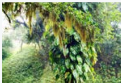
Los bosques atlánticos