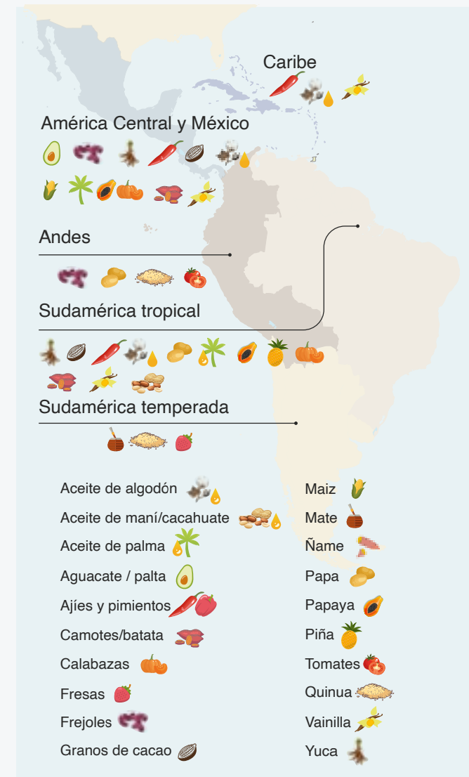
Cuadro 2. Centros de la Agrobiodiversidad en ALC*

La biodiversidad y las culturas tradicionales están estrechamente vinculadas en la región de ALC. Los pueblos indígenas y las comunidades locales han creado diversos sistemas basados en la biodiversidad que les proporcionan medios de vida, alimentos y paisajes productivos desde tiempos ancestrales. 25 En toda la región, el conocimiento y las percepciones locales contribuyen a la gestión responsable de la biodiversidad e informan las estrategias de desarrollo económico sostenible. 26