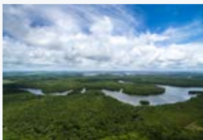
La selva amazónica

BIOCAF 2022-2026 adopta un enfoque ecosistémico transversal. Los ecosistemas se integran en función de su importancia para la biodiversidad global y regional, las oportunidades de impacto social y económico, los riesgos de la inacción, la posibilidad de aprovechar el financiamiento público y privado internacional, y los compromisos nacionales en el marco del Decenio de las Naciones Unidas para la Restauración de Ecosistemas 79 . Los ecosistemas deberán beneficiar a todos los 19 Países Miembros de CAF. Incluyen, pero no se limitan a: