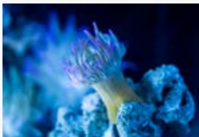
El sistema de barrera de arrecifes mesoamericana