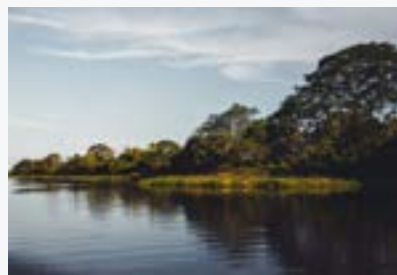
Ecosistemas de la cuenca del Río de la Plata (incluye el Pantanal)