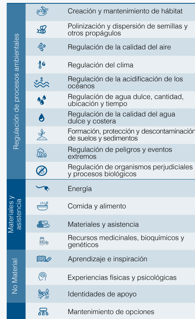
Cuadro 1. Las Contribuciones Económicas del Capital Natural y los Servicios Ecosistémicos