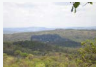
Los bosques y sabanas del Cerrado