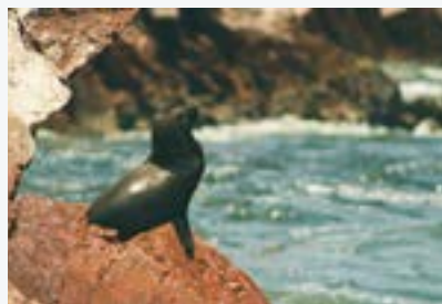
La región de surgencia de la Corriente de Humboldt