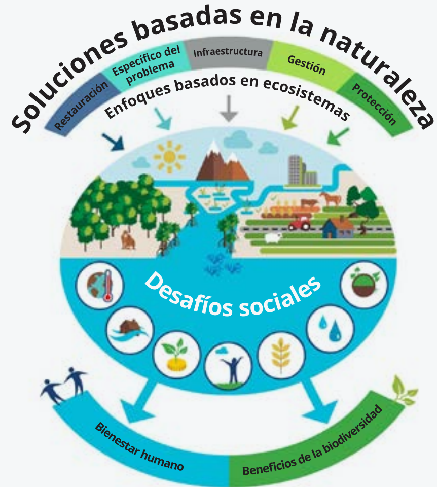
Cuadro 3: Servicios Ecosistémicos

Los formuladores de políticas en ALC y sus socios internacionales tienen una amplia gama de oportunidades para fortalecer la conservación ecológica y promover el uso sostenible de la biodiversidad a través de soluciones basadas en la naturaleza. Las soluciones basadas en la naturaleza se definen como “acciones para proteger, gestionar de manera sostenible, y restaurar ecosistemas naturales o modificados, que abordan los desafíos sociales de manera eficaz y adaptativa, proporcionando simultáneamente el bienestar humano y los beneficios de la biodiversidad”. 49 Muchas de estas oportunidades se están volviendo cada vez más atractivas debido a las tendencias políticas y sociales, tales como un cambio en las preferencias de los consumidores hacia el consumo y la producción sostenibles, los cambios en la demanda del mercado, la introducción de nuevos modelos de negocios, la expansión del comercio internacional, el aumento de la urbanización, y un enfoque en proporcionar soluciones locales para la seguridad alimentaria.